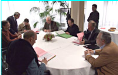
Séance de signatures à la DG le 17/03/08

Nous venons de signer 4 accords dans le cadre du dialogue social, mais le compte n'y est toujours pas.